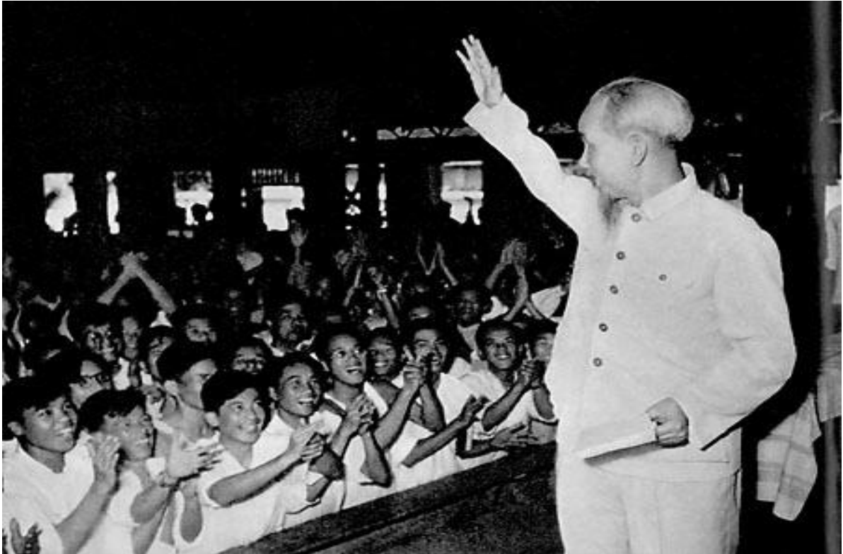
Bác Hồ thăm đại biểu giáo viên toàn miền Bắc năm 1958 (Ảnh tư liệu)

Bác cũng là người được các tác giả nhận định là người vận dụng sáng tạo chủ nghĩa Mác-Lênin. Nhờ đó giúp cuộc chiến tranh gian khổ của dân tộc đi đến thành công. Điều đó đã nâng cao thêm tầm vóc to lớn của Người với toàn nhân loại.