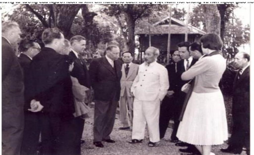
Hồ Chí Minh, Bộ trưởng Bộ ngoại giao đầu tiên của nước ta