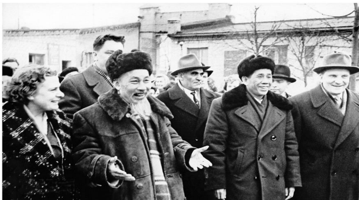
Chủ tịch Hồ Chí Minh cùng Bí thư thứ nhất Lê Duẩn dự Đại hội lần thứ XXII của Đảng Cộng sản Liên Xô, năm 1961.