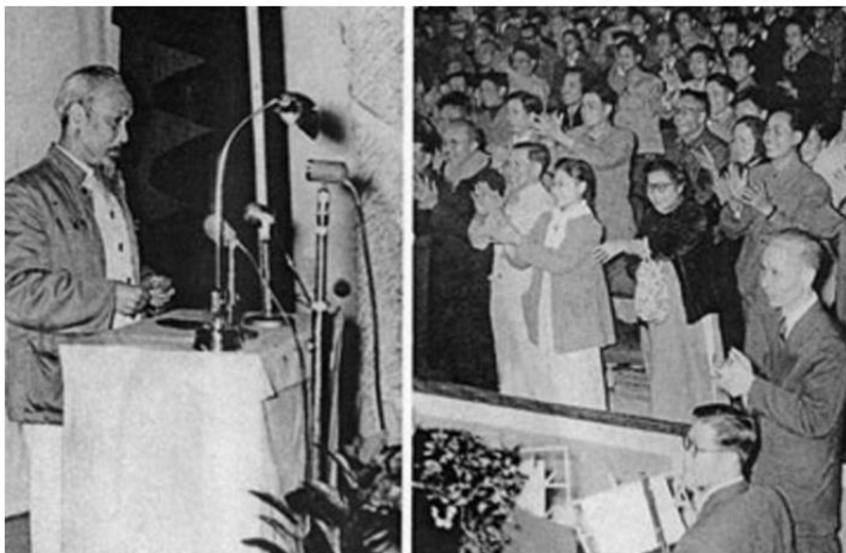
Bác Hồ nói chuyện tại Hội nghị Ngoại giao lần thứ ba tại trụ sở Bộ Ngoại giao (từ 16/12/1963 đến 16/1/1964)