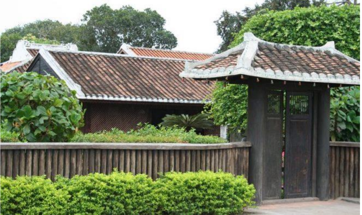
“Mái trường Dục Thanh” nơi khi xưa Bác Hồ từng dừng chân dạy học nơi đây.

Nếu tấm gương thầy cô thực sự sáng thì học sinh sẽ noi theo những phẩm chất việc làm, hành động tốt đẹp của thầy cô mà không cần phải hết sức vận động thuyết phục các em, nếu tấm gương thầy cô thực sự sáng thì sẽ đẩy lùi được những tiêu cực ở nhà trường, góp phần hạn chế những tiêu cực của xã hội.