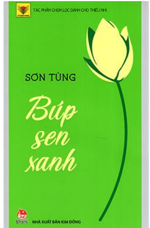
(Hình ảnh nhà văn Sơn Tùng và tác phẩm “Búp sen xanh”, nguồn ảnh mạng)

“Tháp Mười đẹp nhất bông sen Việt Nam đẹp nhất có tên Bác Hồ”.