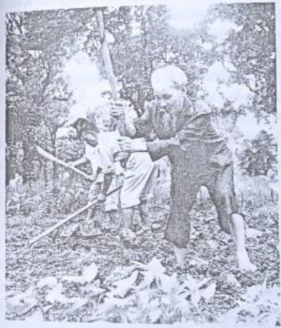
Bác Hồ cuốc đất trồng rau trong vườn Phủ Chủ tịch

Cuộc sống ở Việt Bắc rất khó khăn và gian khổ. Tuy vậy, dù bận đến đâu Bác cũng không quên nhắc nhở, động viên các cán bộ tích cực tăng gia sản xuất để cải thiện đời sống, giảm bớt khó khăn. Ngày ngày, sau giờ làm việc lại thấy Bác đi tăng gia. Quanh khu vực Bác ở, mấy luống rau xanh, vài gốc bầu bí mọc lên là niềm vui, nguồn thức đầy anh em cùng làm theo Bác. Rau của Bác và các đồng chí cán bộ trồng tốt, nhiều khi ăn không hết, Bác lại nhắc đem sang tặng các cơ quan bên cạnh.