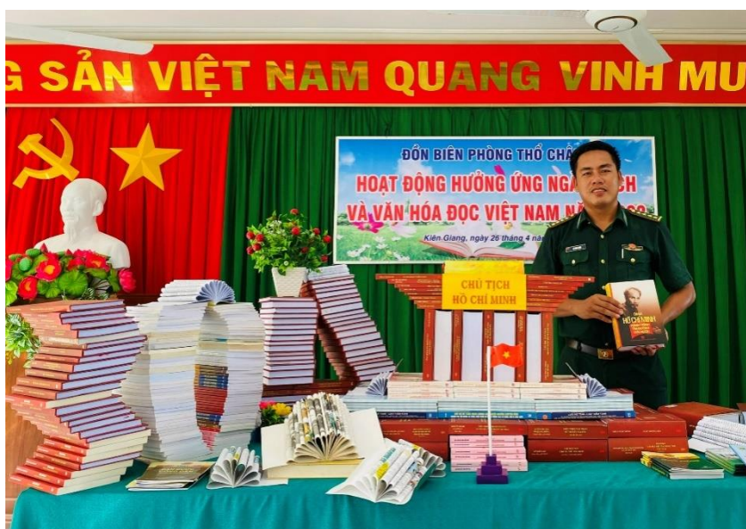
Giới thiệu quyển sách “Chủ tịch Hồ Chí Minh hành trình tìm đường cứu nước” đến cán bộ, chiến sỹ trong đơn vị. Trong dịp Hướng ứng ngày sách và văn hóa đọc Việt Nam.

Qua những kiến thức về lịch sử tôi đã được học trên ghế nhà trường và những quyển sách viết về Bác Hồ tôi đã được đọc. Trong đó có quyển sách “Chủ tịch Hồ Chí Minh hành trình tìm đường cứu nước” của Nhà xuất bản tổng hợp thành phố Hồ Chí Minh, xuất bản năm 2014, của nhiều tác giả, đây là quyển sách viết về cuộc đời cách mạng của Chủ tịch Hồ Chí Minh mà tôi cảm thấy tâm đắc nhất. Quyển sách gồm 04 phần, 1139 trang, tập hợp 115 bài viết của lãnh đạo, nguyên lãnh đạo của Đảng, Nhà nước, các Giáo sư tiến sĩ, Phó giáo sư tiến sĩ, Tiến sĩ ... trong Hội thảo khoa học “Chủ tịch Hồ Chí Minh - Hành trình tìm đường cứu nước (5/6/1911-5/6/2011), do Thành ủy Thành phố Hồ Chí Minh, Ban Tuyên giáo Trung ương, Học viện - Hành chính Quốc gia Hồ Chí Minh, Bộ Văn Văn hóa, Thể thao và Du lịch tổ chức vào tháng 6/2011 tại Thành phố Hồ Chí Minh.