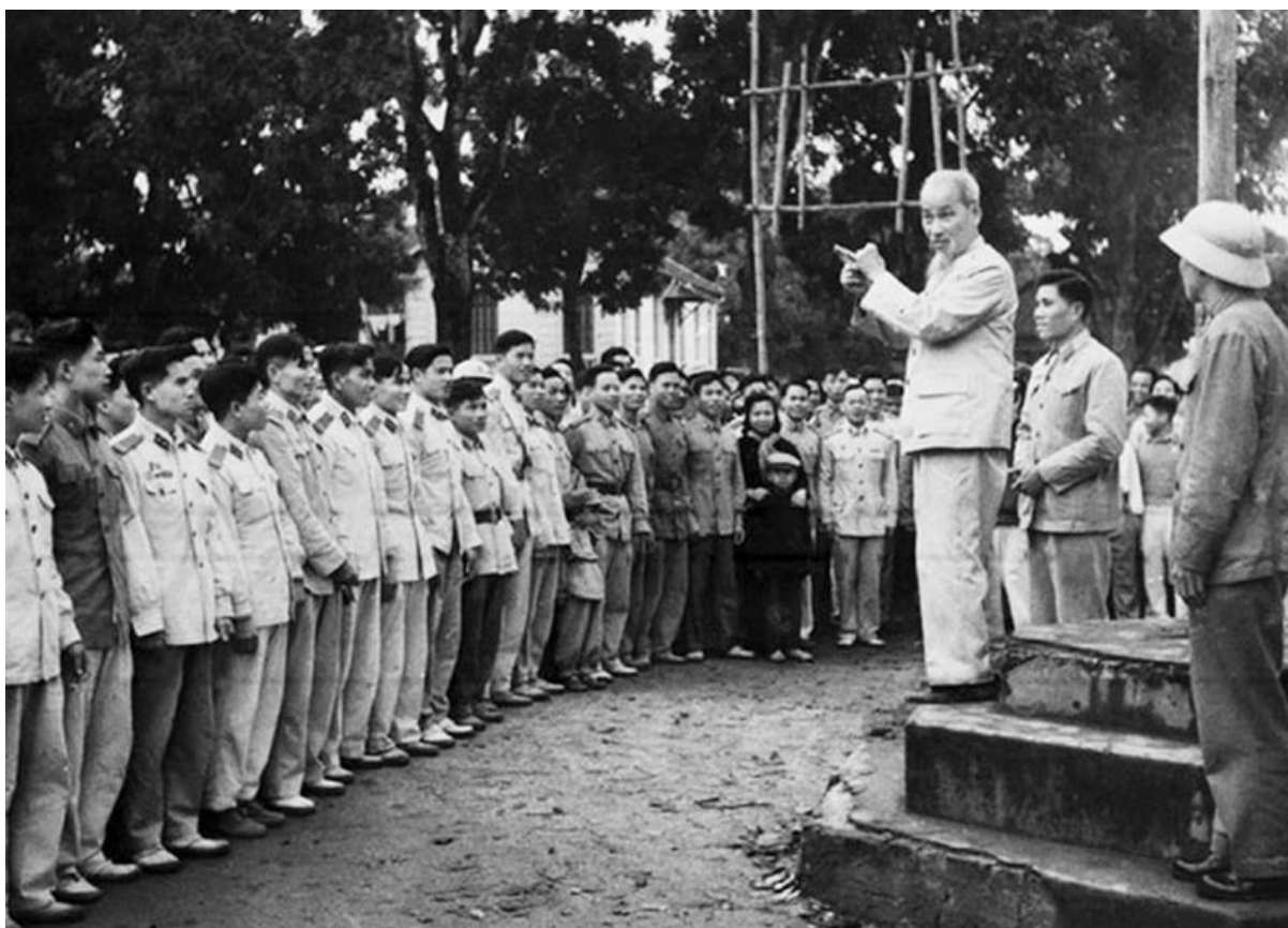
Chủ tịch Hồ Chí Minh thăm đơn vị Công an nhân dân vũ trang bảo vệ Thủ đô ngày 14/2/1961.

Tuy nhiên, thời gian gần đây, bên cạnh những truyền thống tốt đẹp, những thành tích vẻ vang, lực lượng Công an cũng còn một số người sống quan điểm cá nhân “một con sâu làm sàu nồi canh”; một số cán bộ, chiến sĩ vi phạm kỷ luật trước những cám dỗ của vật chất, thậm chí có nhiều cán bộ phải chấp nhận ra quân, thậm chí phải vướng vào vòng lao lý; một số cán bộ trẻ chưa thật sự toàn tâm, toàn ý với công việc; thái độ ứng xử với nhân dân chưa tốt, gây dư luận xấu, làm giảm niềm tin của quần chúng nhân dân vào lực lượng Công an. Bên cạnh đó, các thế lực thù địch bên ngoài gia tăng các hoạt động chống phá, chúng thực hiện âm mưu “diễn biến hòa bình”; bạo loạn lật đổ ở nước ta với quy mô ngày càng mở rộng với thủ đoạn thâm độc hòng xóa bỏ vai trò lãnh đạo của Đảng cộng sản.