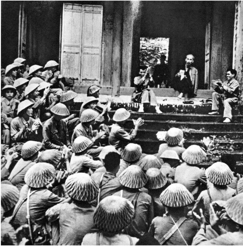
Hồ Chủ tịch thăm các chiến sĩ khi đến thăm đền Hùng (Ảnh tư liệu sưu tầm)

Ở phần 1 của cuốn sách là những câu chuyện kể về cuộc sống thường nhật của Bác được kể lại tuy ngắn gọn nhưng hết sức chi tiết và cảm động. Chỉ là những chuyện nhỏ thôi: như chuyện “Bát chẻ sẻ đôi” với đồng chí liên lạc rồi đến câu chuyện kể về các chiến sĩ tại Việt Bắc đã được Bác gửi “bồi dưỡng” một đĩa cơm rang trứng, tuy chỉ là một đĩa cơm rang trứng quá đỗi bình thường nhưng ngày ấy bộ đội ta mỗi bữa được một bát cơm lưng lưng, độn ngô, độn khoai và Bác