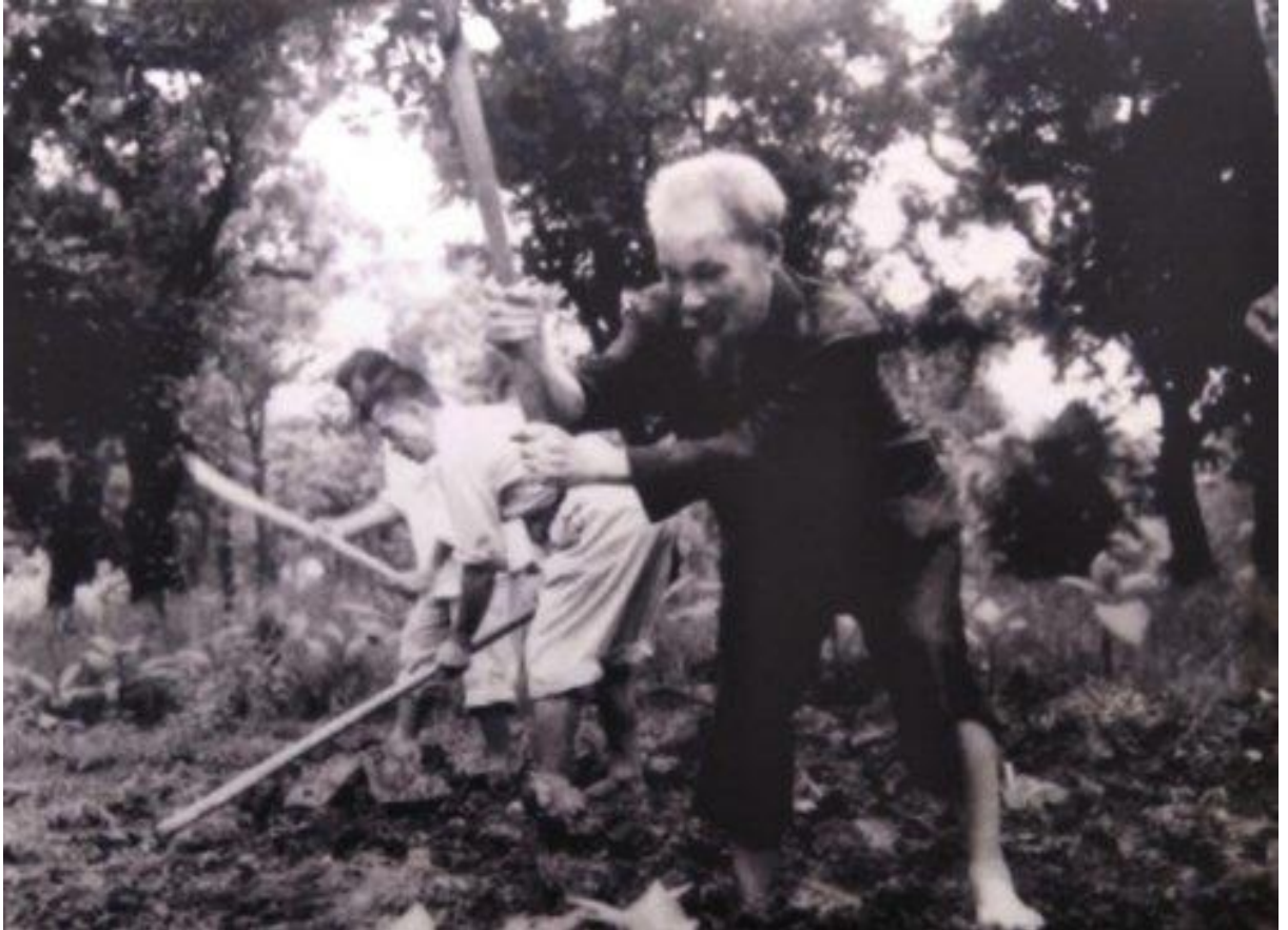
Hình ảnh Bác Hồ tặng gia sản xuất

đạo đức. Muốn hướng dẫn Nhân dân, mình phải làm mực thước cho người ta bắt chước”. Tự mình phải chính trước mới giúp người khác chính. Mình không chính, mà muốn người khác chính là vô lý. Trong quyển sách “Tám gương Bác - Ngọc quý của mọi nhà”, thông qua các câu chuyện như “Bác là người lao động”, “Đạo đức người ăn cơm”, “Bữa cơm của Bác”... giúp người đọc tự cảm nhận một cách sâu sắc rằng: bản thân mỗi người cần nêu gương trên ba mối quan hệ với mình, với người, với việc.