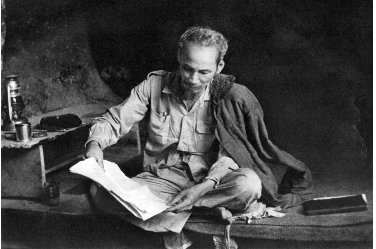
Chủ tịch Hồ Chí Minh đọc sách tầm gương sáng để chúng ta noi theo

Ngày nay, chúng ta nghe nhiều về khái niệm đọc sách. Theo tôi, đọc sách đã và đang hiện hữu trong cuộc sống hằng ngày, là nhu cầu của mỗi người để từ việc đọc giúp mỗi người hướng con người đến chân thiện mỹ. Đọc sách truyền tải những nội dung nhân văn, giáo dục con người về tình cảm yêu thương lẫn nhau, về chân thiện mỹ, lối sống và đạo đức con người. Bởi vậy, đọc sách sẽ giúp con người hướng đến những điều tốt đẹp trong cuộc sống và đặc biệt là đọc các tác phẩm về Chủ tịch Hồ Chí Minh.