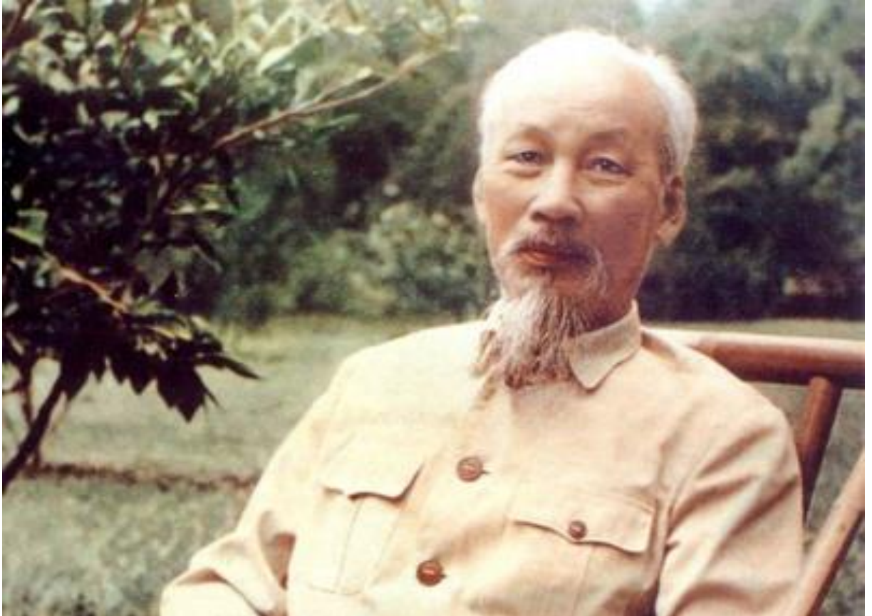
Chân dung Chủ tịch Hồ Chí Minh

Hồ Chủ tịch là biểu tượng cao đẹp nhất của chủ nghĩa yêu nước và chủ nghĩa quốc tế vô sản. Người đã hết lòng, hết sức phục vụ cách mạng, phụng sự Tổ quốc, phục vụ nhân dân, cống hiến cả cuộc đời mình cho sự nghiệp cách mạng giải phóng giai cấp, giải phóng dân tộc, giải phóng loài người. Khi còn sống, Bác luôn luôn đồng cam cộng khổ với nhân dân, “lo trước cái lo của thiên hạ vui sau cái vui của thiên hạ”. Trước khi qua đời, Người chỉ tiếc rằng “không được phục vụ lâu hơn nữa, nhiều hơn nữa”.