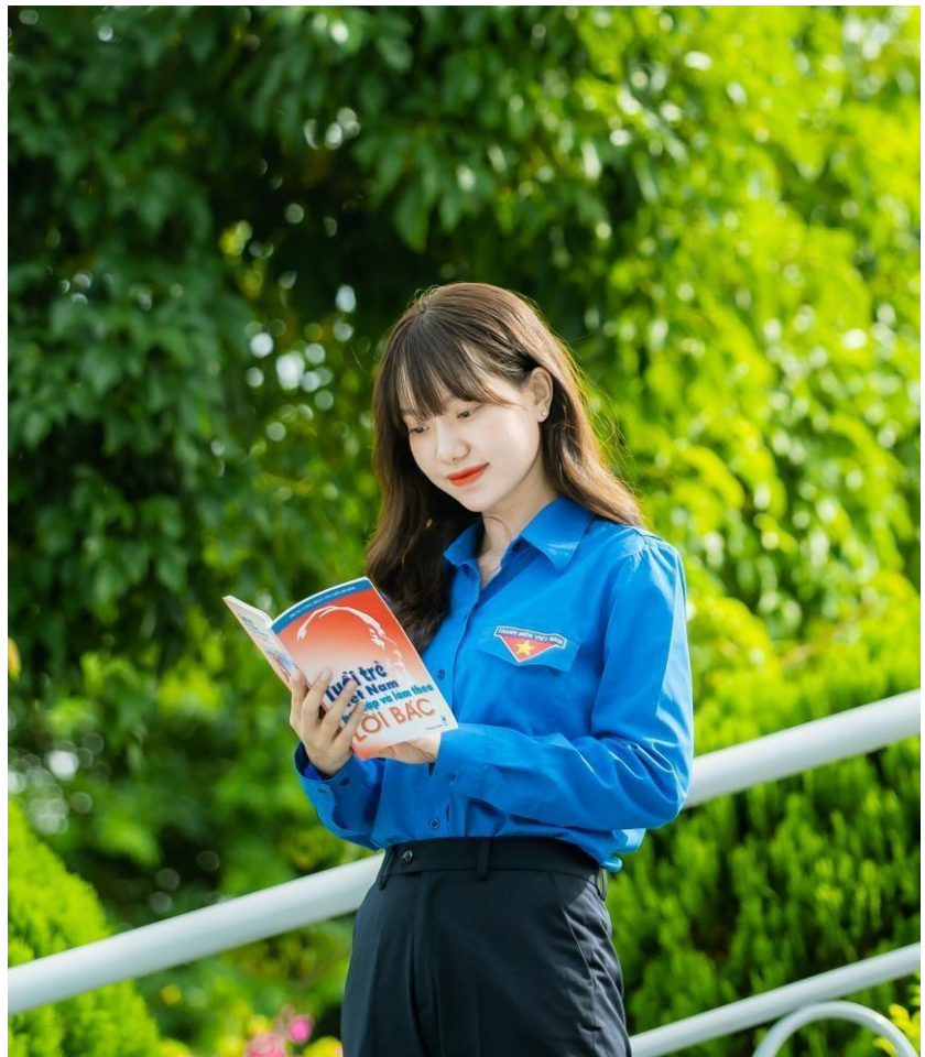
Lời dạy của Bác là hành trang mang theo suốt cuộc đời

Hai là , phải tin tưởng sâu sắc ở lực lượng và trí tuệ của tập thể, của nhân dân; tăng cường đoàn kết và giúp đỡ lẫn nhau; nâng cao ý thức tổ chức kỷ luật; kiên quyết chống